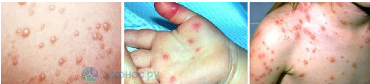
фото: проявления энтеровирусной экзантемы при поражении вирусом Коксаки