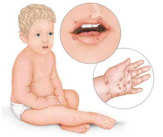
фото: кожные симптомы вируса Коксаки у ребенка

Самая восприимчивая к заболеванию категория – дети дошкольного и младшего школьного возраста. Интересно, что груднички почти не заражаются вирусом Коксаки. Вероятно, это связано с тем, что в их крови около 6 месяцев находятся антитела матери, защищающие новорожденного от самых разных инфекций. Постепенно активность этих секьюрити уменьшается, и дети становятся более восприимчивыми к инфицированию. В выигрышном положении оказываются малыши, которых мать долго кормит грудным молоком. Как известно, именно с грудным молоком в организм ребенка попадают антитела. Но все-таки полностью вопрос об иммунитете не выяснен. Отмечены случаи очень тяжелой формы заболевания у новорожденных.